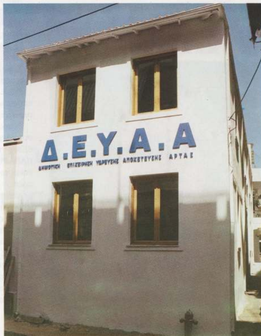
Τα ιδιόκτητα γραφεία της Δ.Ε.Υ.Α.Α. στην οδό Β. ΠΥΡΡΟΥ (Κατασκευάστηκαν το 1994)