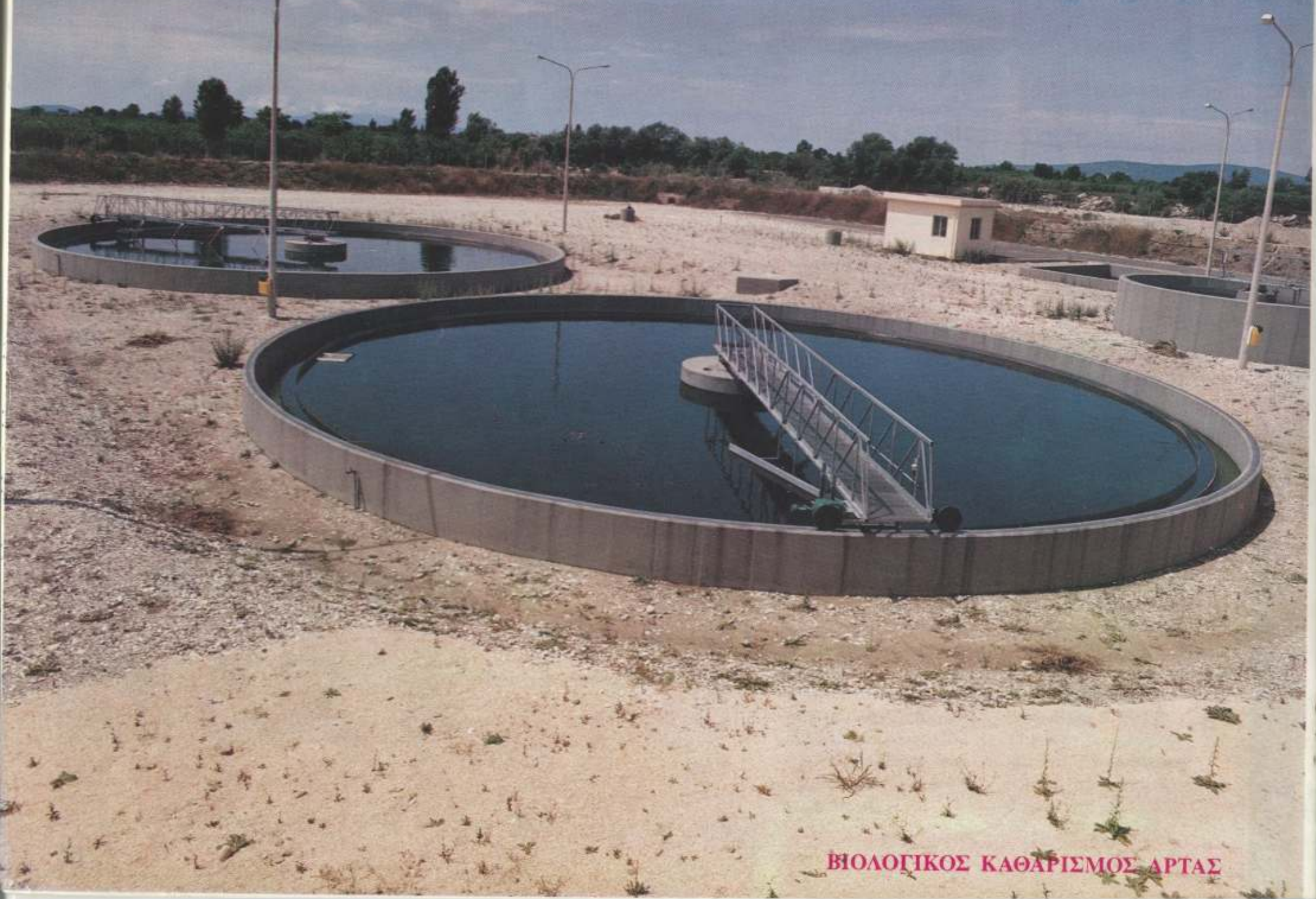
ΒΙΟΛΟΓΙΚΟΣ ΚΑΘΑΡΙΣΜΟΣ ΑΡΤΑΣ