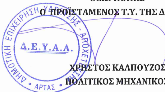
ΧΡΗΣΤΟΣ ΚΑΛΠΟΥΖΟΣ ΠΟΛΙΤΙΚΟΣ ΜΗΧΑΝΙΚΟΣ