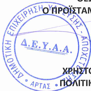
ΧΡΗΣΤΟΣ ΚΑΛΠΟΥΖΟΣ ΠΟΛΙΤΙΚΟΣ ΜΗΧΑΝΙΚΟΣ